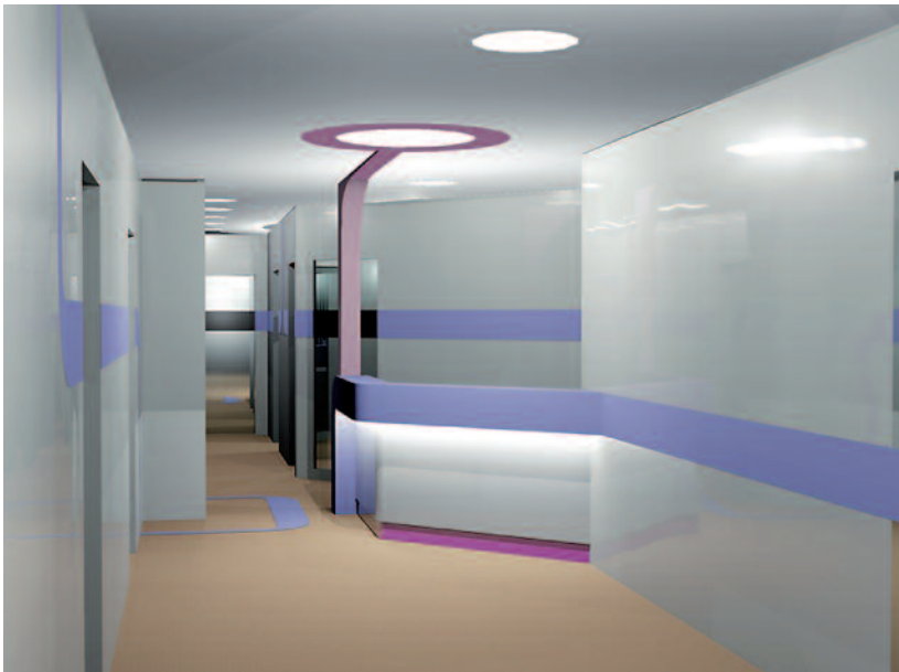
Abb. 6: Das Empfangsmöbel präsentiert sich nun wie ein Raumelement. Die Wandgestaltung fließt wie aus einem Strich vom Tresen, über Wände, Decke, Boden, und endet hinter dem Tresen. Der breite Strich lenkt die Patienten in Richtung Empfang und Behandlung. Auch zwischen den Türen taucht dieser Strich auf und wird hier als Beschriftungsfeld für die jeweiligen Räume genutzt.