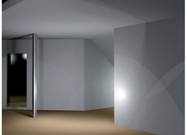
Abb. 1: Die Ausgangssituation der Nische, in der ein Empfang entstehen soll. Geprägt von einem Doppel-T-Träger als Stütze, der aus statischen Gründen nicht zu entfernen ist. Tageslicht kommt in diesem kompletten Raum zu kurz.