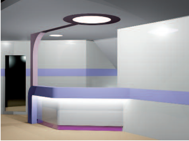
Abb. 2: Ein Empfangsmöbel mit Wiedererkennungswert, wie ein Zahn, in den Raum verwurzelt. Die störende Stütze wurde komplett verkleidet. Diese Verkleidung schafft eine Verbindung zur eingelassenen Deckenleuchte.

Rolle. Hier gilt es, die richtige Nuance zu treffen. Schnell werden 50 ähnliche Farben aussortiert, bis die richtige gefunden wird. Kinderzahnärzte sind auf farbpsychologische und formpsychologische Aspekte angewiesen. Gleiches gilt für Ärzte, die Angstpatienten oder geistig behinderte Menschen behandeln. Die Farbauswahl von Konfektions- und Systemmöbeln ist so stark eingeschränkt, dass es unmöglich ist, mit einem Dutzend Primärfarben farbpsychologisch zu arbeiten. Weiter geht es mit der Oberflächenbeschaffenheit. Von matten über hochglänzende bis strukturierte Oberflächen kann man die Raumwirkung beeinflussen und z. B. kleine Räume durch Spiegelungen und helle Farben optisch größer wirken lassen.