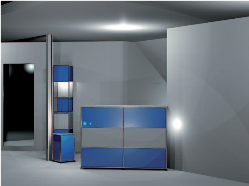
Abb. 3: Der Objekteinrichter hatte die Idee, die Systemmöbel einheitlich anzubieten. Zwischen der Stütze und dem Empfangstresen soll ein Blumentopf für einen großen Baum stehen, der die Stütze verdeckt. Der Vitrinenturm im Hintergrund soll weiteren Stauraum schaffen.

werden oder in Widerspruch geraten. Wenn die Praxis individuell und ganzheitlich gestaltet wird, wirkt das gesamte Praxisunternehmen durchdacht, glaubwürdig, konsequent und strukturiert. Die Behandlung selbst wird als individuell und professionell betrachtet. Die Parallelen zwischen der Praxiseinrichtung und der Leistung des Arztes werden vom Patienten genauer unter die Lupe genommen. Ein Urteil über das Unternehmen wird vom Patienten vor der Behandlung intuitiv getroffen. Letztendlich stärkt die durchgehende optische Linie, durch Maßmöbel, das Vertrauen dem Arzt gegenüber und seine Leistung wird gleichwertig eingeschätzt.